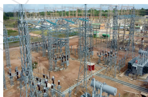
SE Vila do Conde-PA Eletronorte