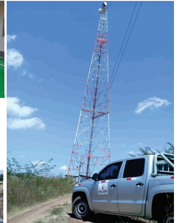
Pintura de Torres - Vale