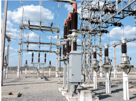
Subestação Pedreiras Cemar