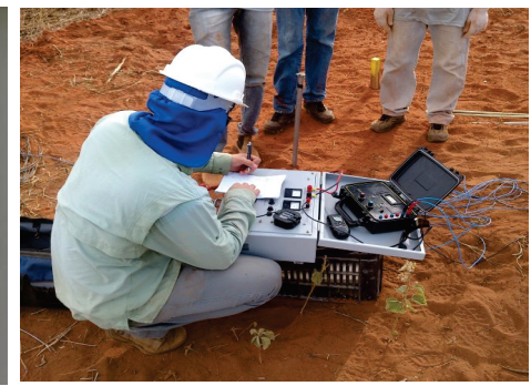
Estudo de Resistividade de Solos.