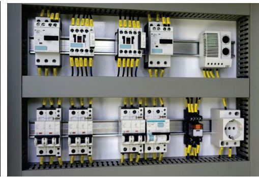
Montagem de Painéis Elétricos