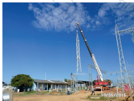
Montagem Portico Altamira-PA Eletronorte