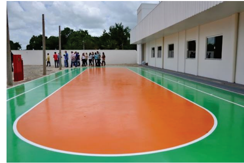
Centro Reabilitação Coroatá-SES-MA